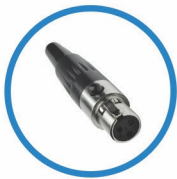
Conector Mini XLR