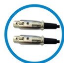
Cabo XLR / XLR de 5 metros