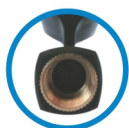
Cachimbo com rosca metálica