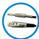
Cabo XLR / P10 de 5 metros