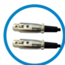
Cabo XLR / XLR de 5 metros