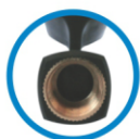
Cachimbo com rosca metálica