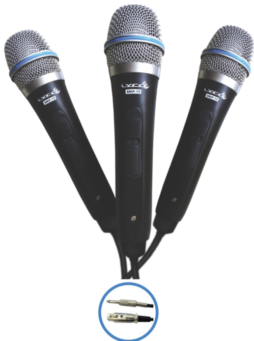
Cabo XLR / P10 de 3 metros