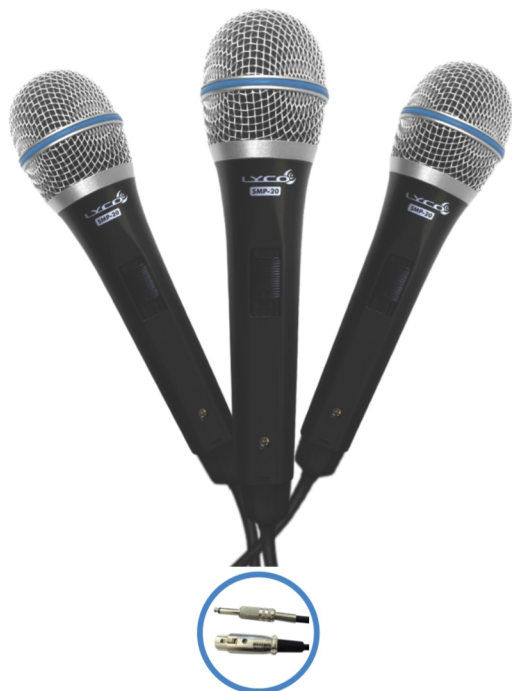
Cabo XLR / P10 de 3 metros